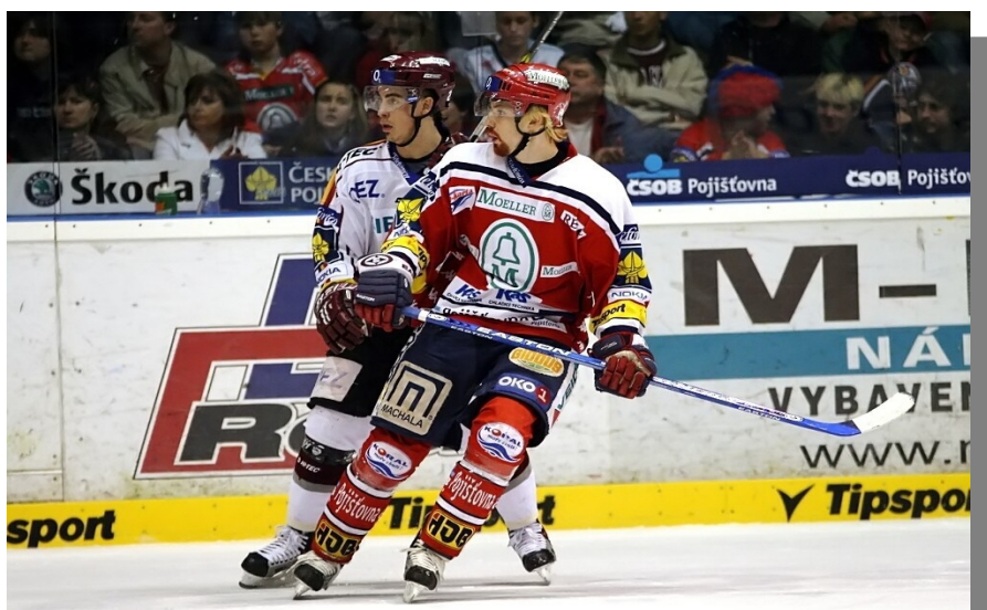
Momentka z finálové série Pardubic a Sparty před dvěma lety.